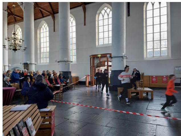
25-1 kwamen de Roparunners door De Burght, het Smartlappenkoor zong ze toe.

Rond 22.00uur sluit Meta af met een gebed.